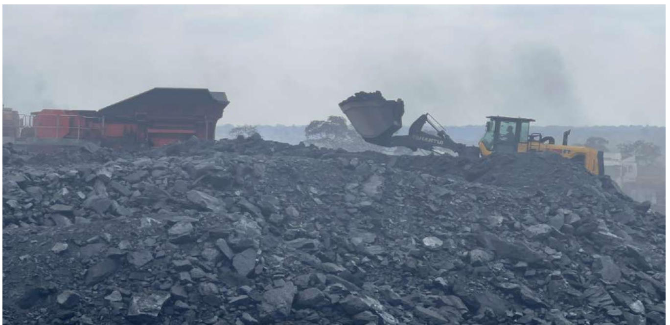
Mradi wa mgodi wa makaa ya mawe wa Jitegemee wilayani Mbinga

Amesema TIC inatoa elimu endelevu ya uwekezaji na kuhamasisha usajili wa miradi ili wawekezaji waweze kunufaika na vivutio vya kikodi na visivyo vya kikodi vinavyotolewa na Serikali.