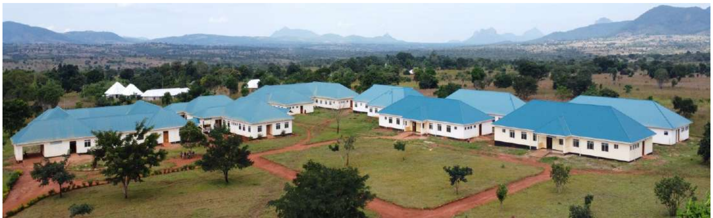
Baadhi ya majengo katika hospitali ya Mpitimbi wilayani Songea

Akizungumza na waandishi wa habari ofisini kwake Mwampamba amesema zoezi hilo limefanyika kwa kaya 76,843 zilizopo ndani ya Manispaa ya Songea.