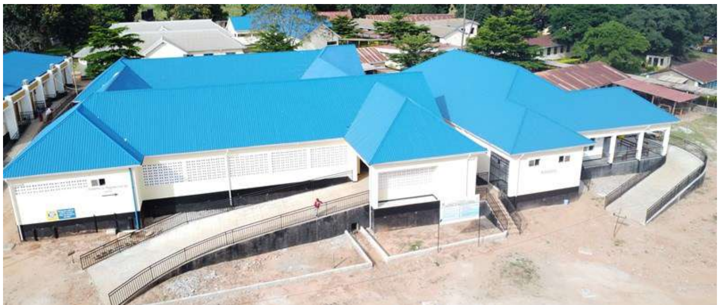
Baadhi ya majengo katika hospitali ya Wilaya ya Tunduru.

Mkuu wa Mkoa wa Ruvuma anafanya ziara ya kikazi katika Halmashauri zote nane za Mkoa wa Ruvuma kwa lengo kuzungumza na wananchi ,kusikiliza kero zao na kupashana Habari za maendeleo zinazofanywa na serikali ikiwemo utekelezaji wa miradi ya maendeleo.