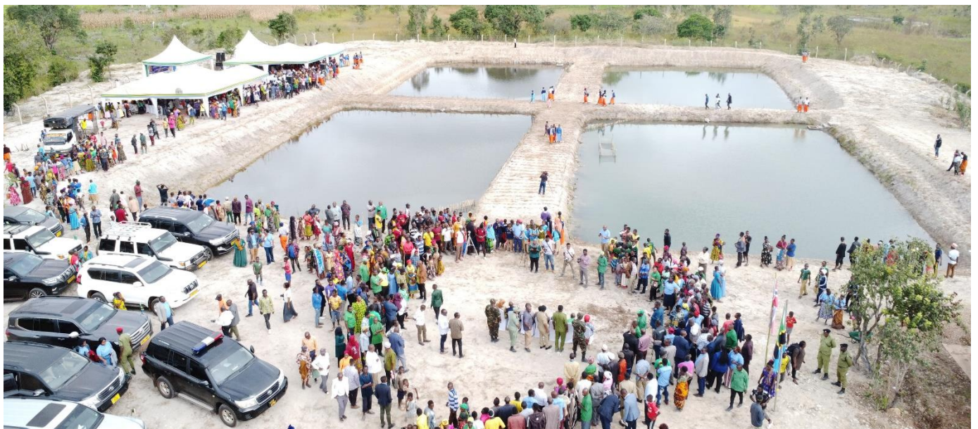
Shamba darasa la ufugaji endelevu wa viumbemaji kwenye mabwawa ya Kijiji cha Mpitimbi wilayani Songea

Amesema Samaki wa mabwawa wanaweza kumaliza changamoto ya udumavu kwenye Mkoa wa Ruvuma ambapo hivi sasa udumavu umefikia asilimia 37 katika Mkoa wa Ruvuma , licha ya Mkoa huo kutajwa kuwa ni ghala la chakula nchini.