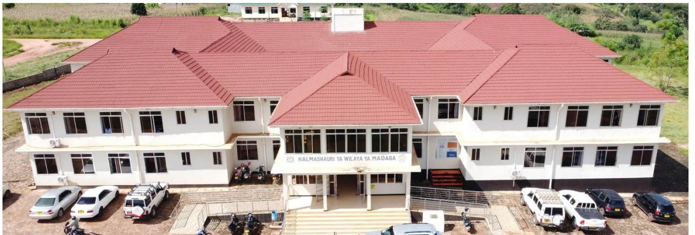
Jengo la Halmashauri ya Madaba wilayani Songea mkoani Ruvuma