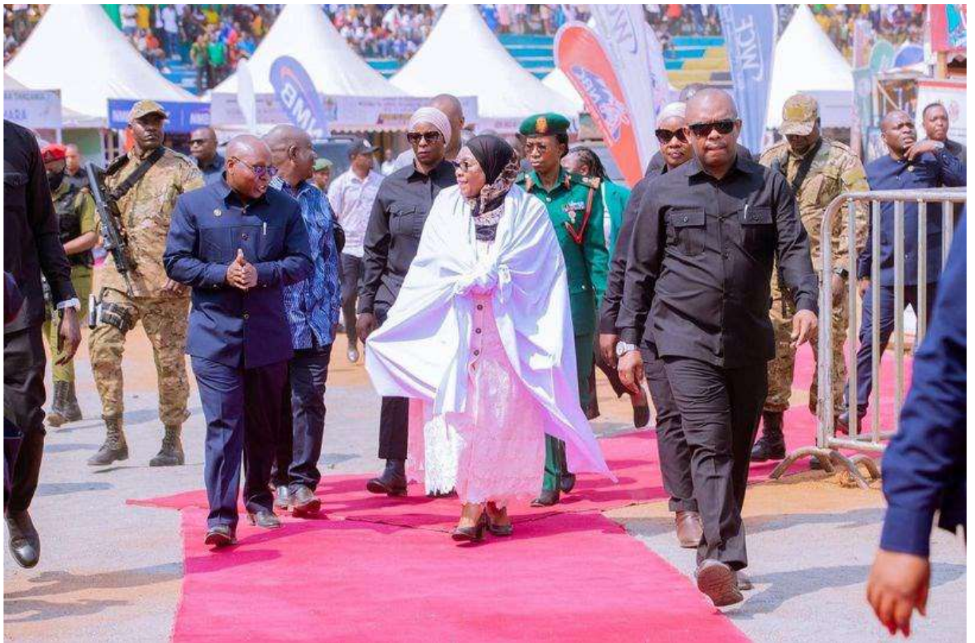
Rais wa Jamhuri ya Muungano wa Tanzania Mhe. Dkt. Samia Suluhu Hassan