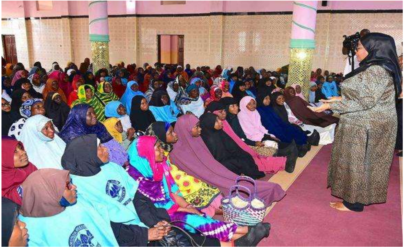
Rais wa Jamhuri ya Muungano wa Tanzania Mhe. Dkt. Samia Suluhu Hassan akishukuru mara baada ya kusomewa Dua katika Msikiti Mkuu wa Wilaya ya Tunduru, Mkoani Ruvuma