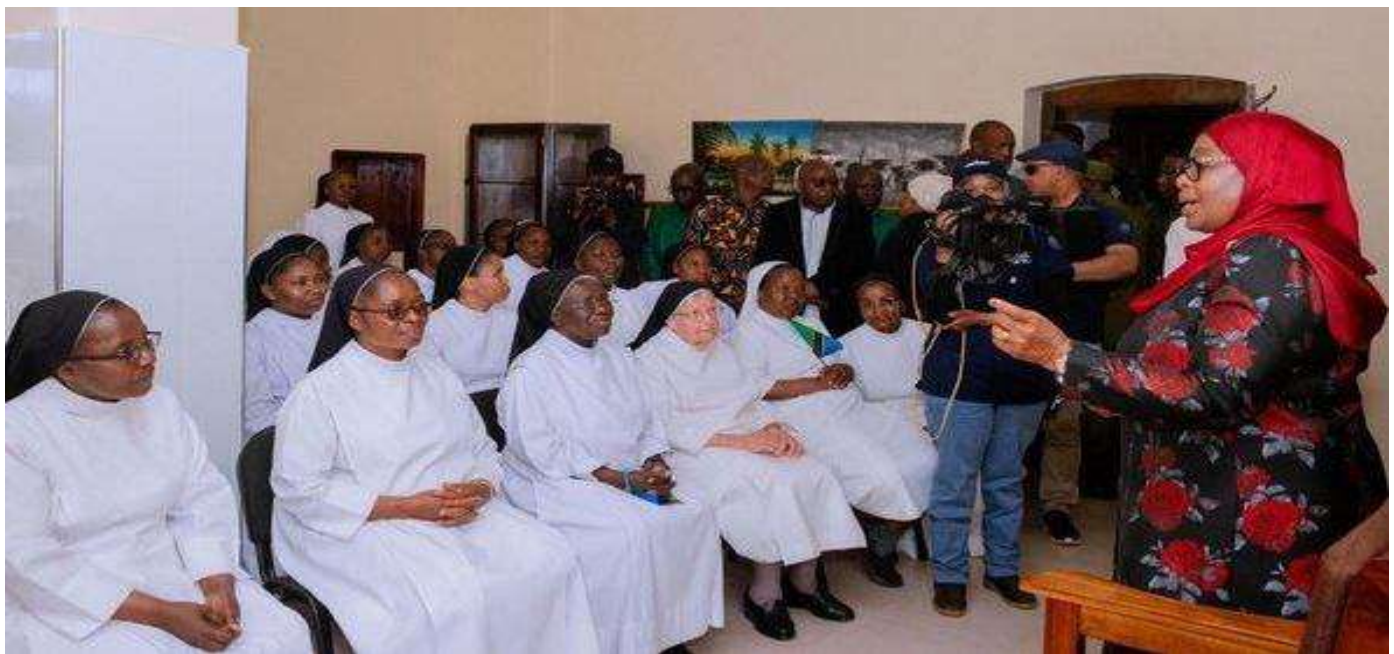
Rais wa Jamhuri ya Muungano wa Tanzania Mhe. Dkt. Samia Suluhu Hassan akizungumza na Watawa wa Shirika la Benedicto wa Tutzing mara baada ya kutembelea Kanisa la Mt. Benedicto, Parokia ya Peramiho, Jimbo Kuu la Songea mkoani Ruvuma