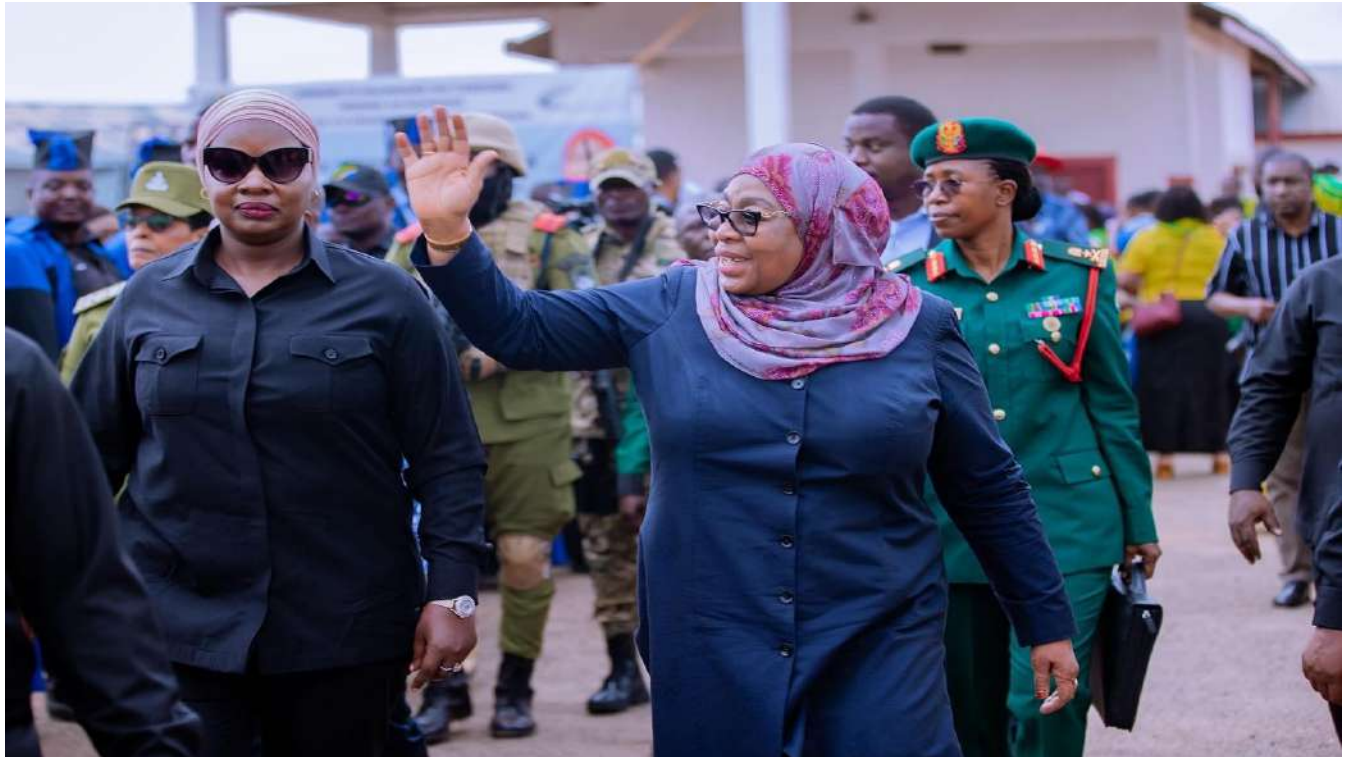
RAIS SAMIA AWASILI UWANJA WA MAJIMAJI KUFUNGA TAMASHA LA UTAMADUNI LA KITAIFA