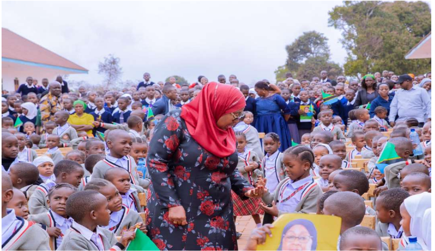
Wanafunzi wa shule ya msingi ya Chifu Zulu iliyoopo Manispaa ya Songea walimshangaza Rais Dkt.Samia Suluhu Hassan baada ya kumchangia fedha