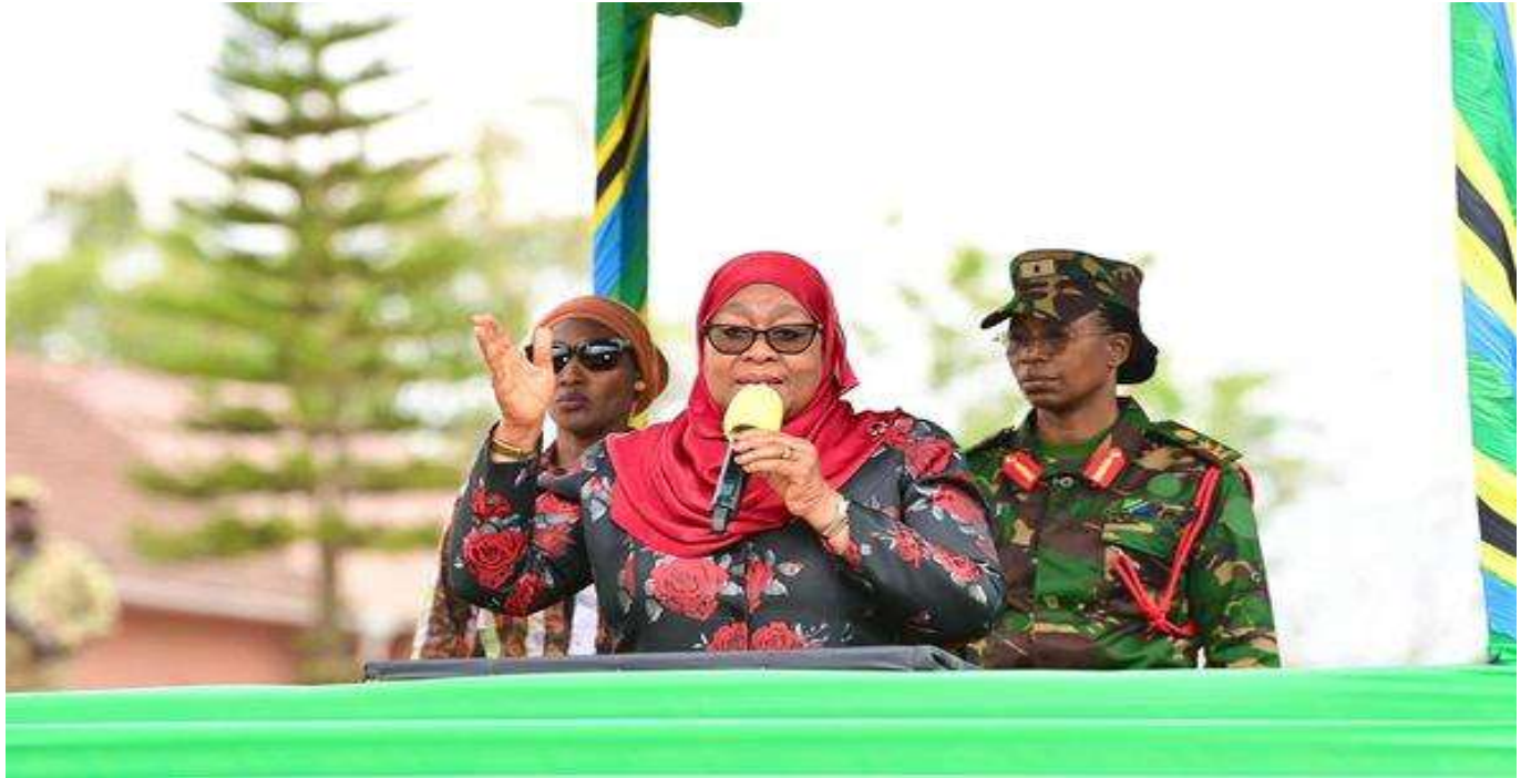
Rais wa Jamhuri ya Muungano wa Tanzania Mhe. Dkt. Samia Suluhu Hassan akizungumza na Wananchi wa Jimbo la Peramiho, katika muendelezo wa Ziara yake ya Kikazi mkoani Ruvuma