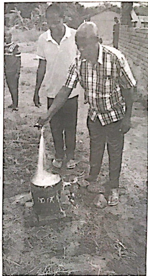
Diwani wa Kata ya Lituta Olaph Pili akifungua maji ya bomba katika Shule ya Sekondari Madaba yaliyoanza kutoka Januari 18 na kumaliza kero ya maji katika sekondari hiyo.

walikuwa wanapata shida ya maji, lakini baada ya mradi huu sasa Madaba haitakuwa na shida tena ya maji, tuna maji ya kutosha", alisisitiza diwani huyo.