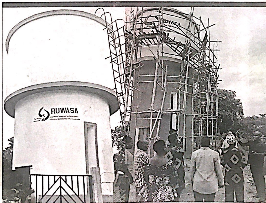
Mradi wa maji Kijiji cha Lituta, Halmashauri ya Madaba uliogharamu zaidi ya Sh bilioni 1.03.